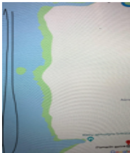
Картинка 2. Малый марафон на дистанцию 2 км.

Сбор 15 евро с участника. Оплата банковским переводом на счет получателя по вышеуказанным реквизитам.