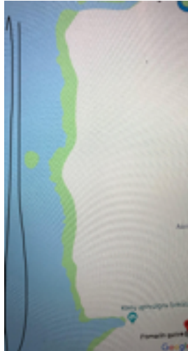
2 paveikslėlis. Mažasis Kintų plaukimo maratonas – 2 km. nuotolis